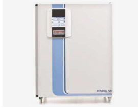
హెరాసెల్ సిబి2 ఇంక్యూబేటర్