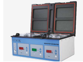
కుక్ బెంచ్టాప్ ఇంక్యూబేటర్