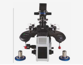
ఆర్.ఐ. ఐ.సి.ఎస్.ఐ. మెషన్